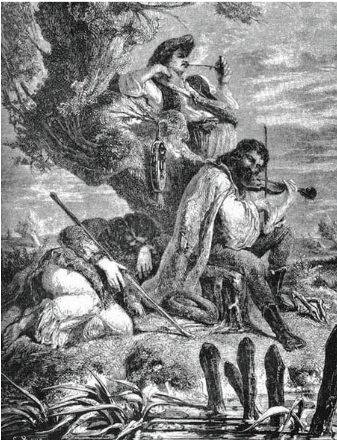
ROMANTISCHER STICH „DIE DREI ZIGEUNER“ NACH NIKOLAUS LENAUS GEDICHT

Allerdings war in der Epoche des Biedermeiers die Sehnsucht nach Ruhe, Ordnung und Kleinbürgerlichkeit groß. Man wollte bescheiden und häuslich sein und legte mehr Wert auf das „kleine Glück“. Wenn Nikolaus Lenau in seinem Lied die Wesenshaltung der Sinti und Roma beschreibt, nennt er genau diese Lebenseinstellungen. Seine „Zigeuner“ sind genügsam, schlafen seelenruhig in der Heide, sind mit der Natur verbunden. Sie genießen den Augenblick und lassen sich nicht von dem mühsam vorankommenden Fuhrwerk des lyrischen Ichs stören. Super, müsste man denken, endlich mal eine Zeit in der nicht nur das Negative gesehen wird; in der Sinti und Roma sogar als Vorbild fungieren! Doch Ausgrenzung bleibt Ausgrenzung, denn obwohl nun teilweise mit positiven Attributen versehen, bleiben die Stereotype vorhanden, die eine Integration oder Akzeptanz der Sinti und Roma verhindern. „Zigeuner“ werden weiterhin als fremd angesehen und damit ausgegrenzt und bis heute fällt es vielen Menschen schwer, sich ihnen zu öffnen.