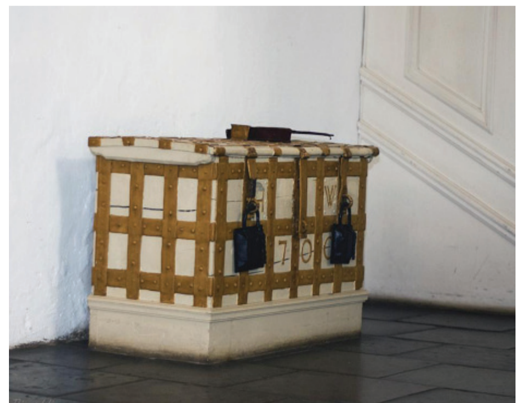
ARMENKASTEN 1700, HOLZ, ©CHRISTKIRCHENGEMEINDE RENDSBURG-NEUWERK

Nein, es wurden nicht alle Bettler unterstützt. Fremde Bettler wurden des Landes verwiesen und auf eine Stufe mit Dieben und anderen Verbrechern gestellt. Die Glaubensflüchtlinge jedoch, die aufgrund ihres evangelischen Glaubens aus ihrer Heimat flüchten mussten, wurden unterstützt – sofern sie Belege ihrer Gemeinde vorlegen konnten – ansonsten wurden sie ausgewiesen.